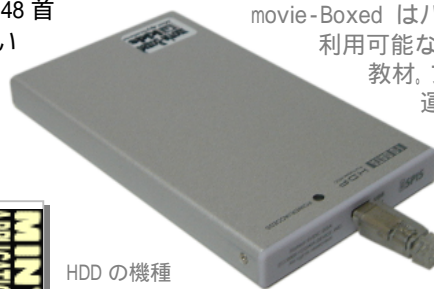
HDD の機種 外觀は変更することがあります

ポータブル HDD に、ソフトとコンテンツを収納 (対応 OS: Windows) movie-Boxed はパソコンに USB 接続するだけで 利用可能なオールインワンユニットの電子 教材。プロジェクトと併用すると教室 運営が見違えるように引き締ま って楽しくなります。